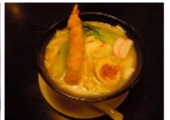
(写真左上) 盛り上がるご当地グルメのイベント(上田会場) (写真左下) くるみ料理コンテストを視察する花岡市長と、道の駅で行われたくるみ祭り表彰式 (写真上) 左から望月のみそかつ丼と佐久の安養寺ラーメン