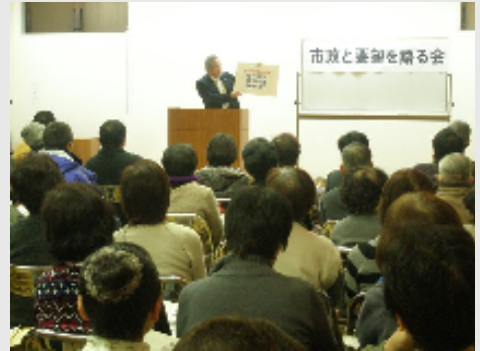
(写真) 昨年の市政と要望を語る会

これからの市政についてお知らせし、皆様のご要望をお聞きする会を開催します。市政に対する疑問や要望など、ご意見をお聞かせいただければと存じます。